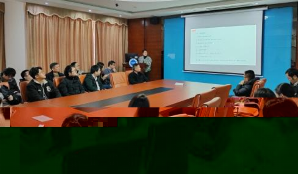
图 员工专业技 培