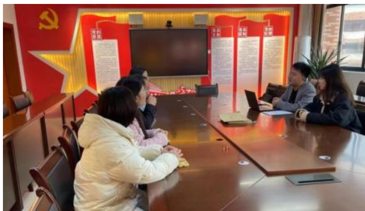
图 企开展学术 交 会